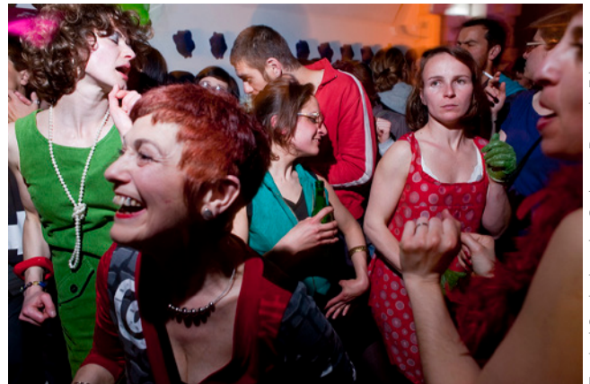
Festival Ouais du polar